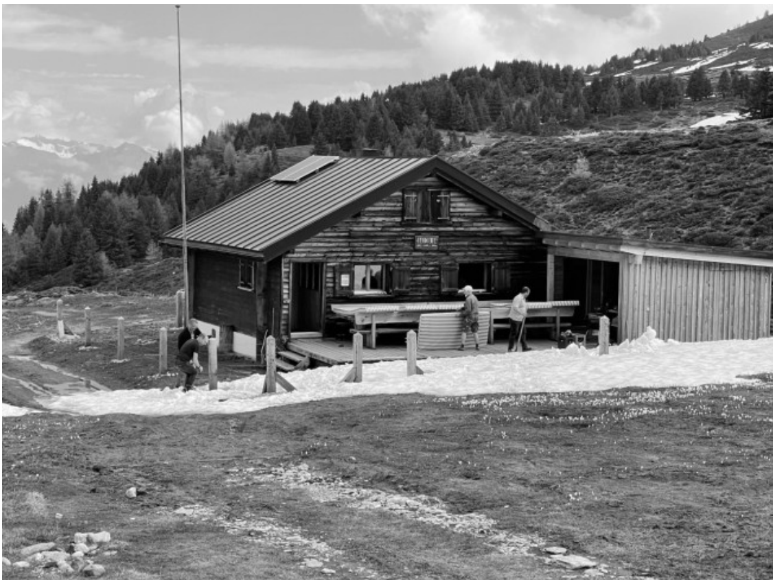
Wann beginnt der Sommer? Putztag mit Schnee 5. Juni 2021