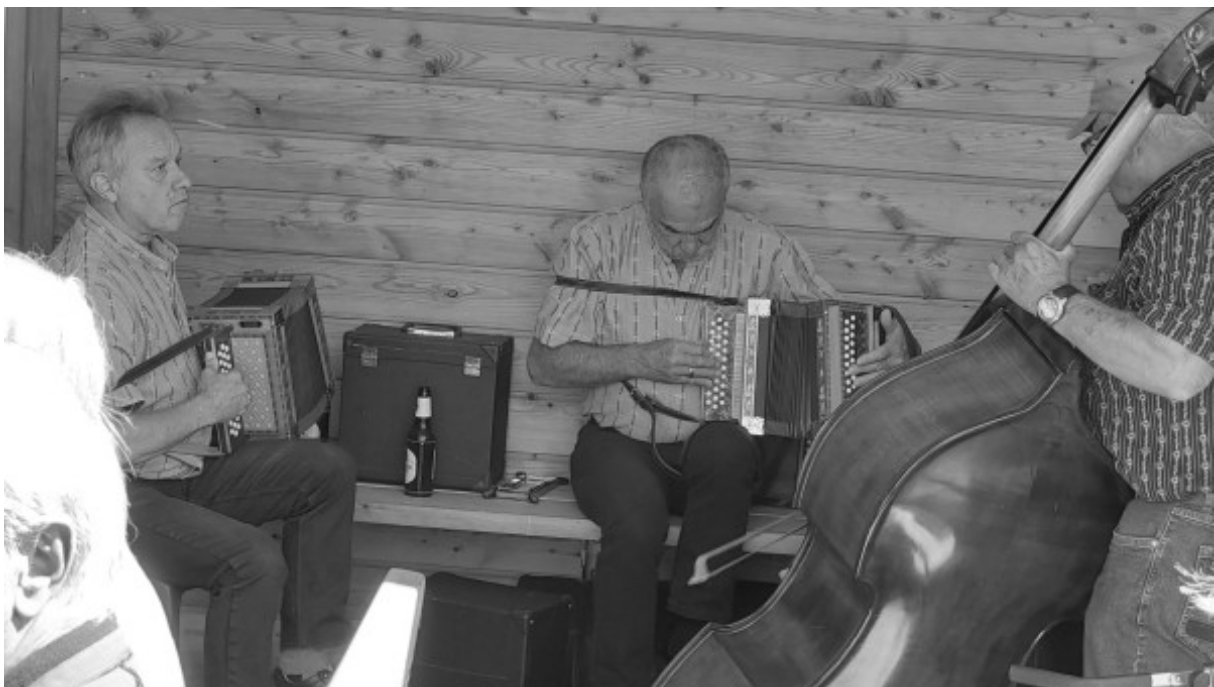
«Piz Fess» sorgt für gute Stimmung