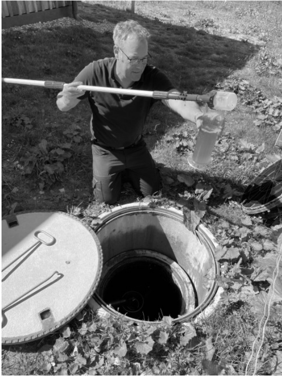
Kontrolle Kläranlage 29. Juni 2021