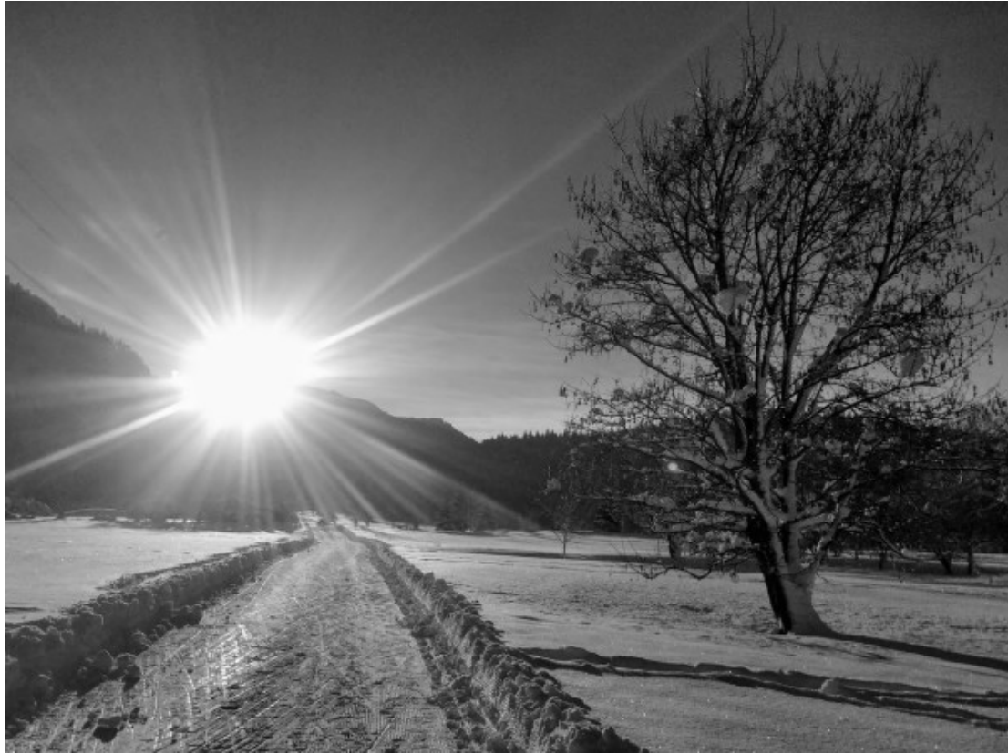
Winterstimmung in Domat/Ems dank der SSCDE Loipe